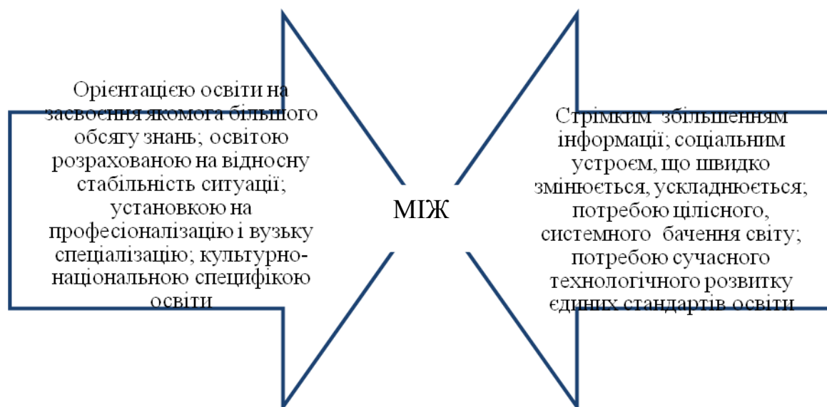
Рис. 1. Значення освіти дорослих у розв’язанні сукупності суперечностей

Передусім сенс освіти дорослих можна пояснити її спрямованістю на усунення наявних суперечностей (Рис. 1):